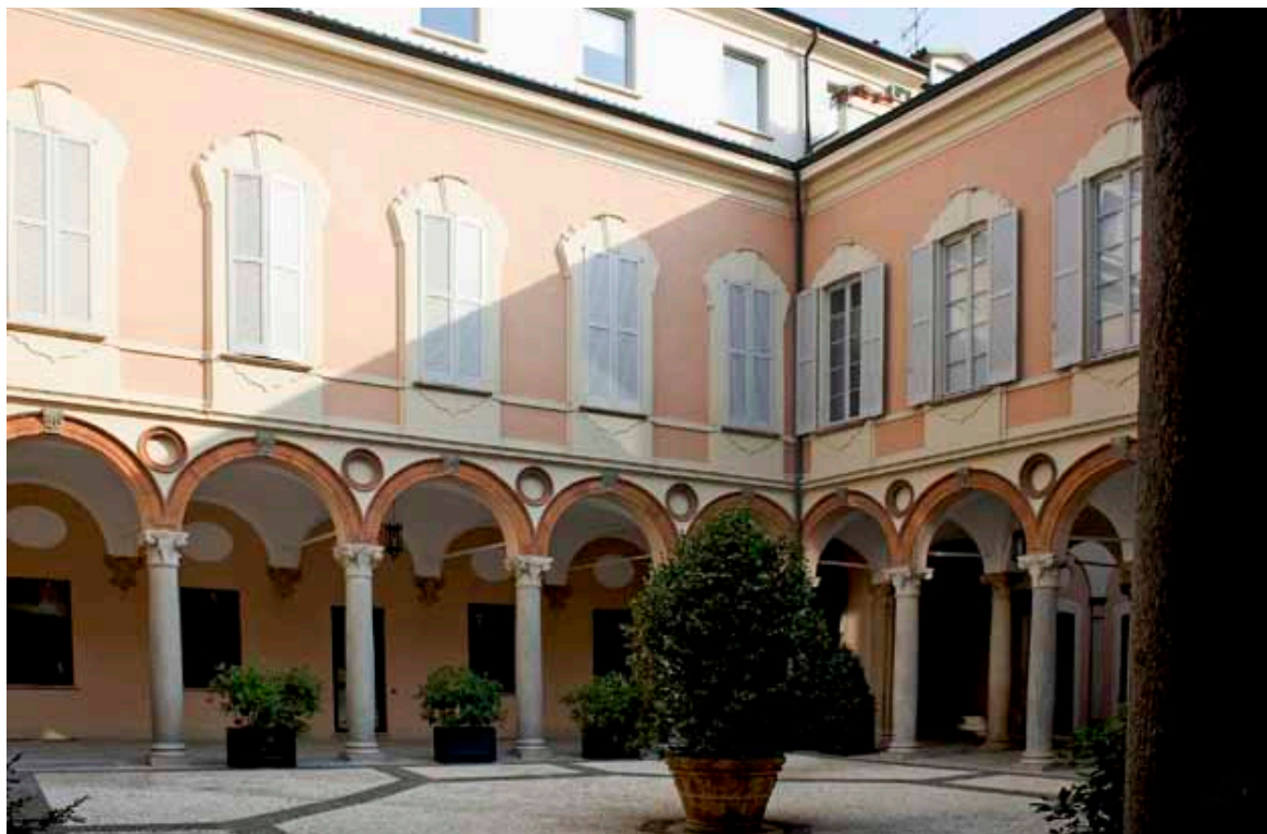
2009-2011 Milano - via Amedei 8

Principali Committenti: Beni Stabili Property Service Spa; CMB Soc Coop RL; IKEA Property Srl; Parrocchia di Sesto San Giovanni