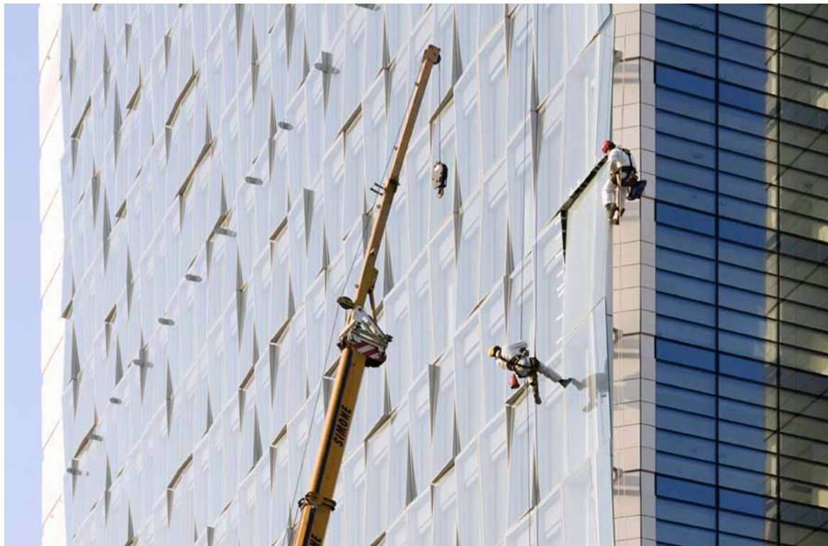
2008-2010 Milano piazza Freud

A°P si occupa della validazione progetti verificandone conformità normativa e tecnica, in fase di progetto definitivo, esecutivo, costruttivo, individuando le possibili interferenze tra i vari ambiti progettuali: architettonico, strutturale, impiantistico, involucro, antincendio, acustico, termico, ecc. In fase costruttiva l'attività si completa con l'assistenza al cantiere. Principali Committenti: Beni Stabili Spa - Development; CMB Soc Coop RL; Lualdi Spa; Maltauro Spa