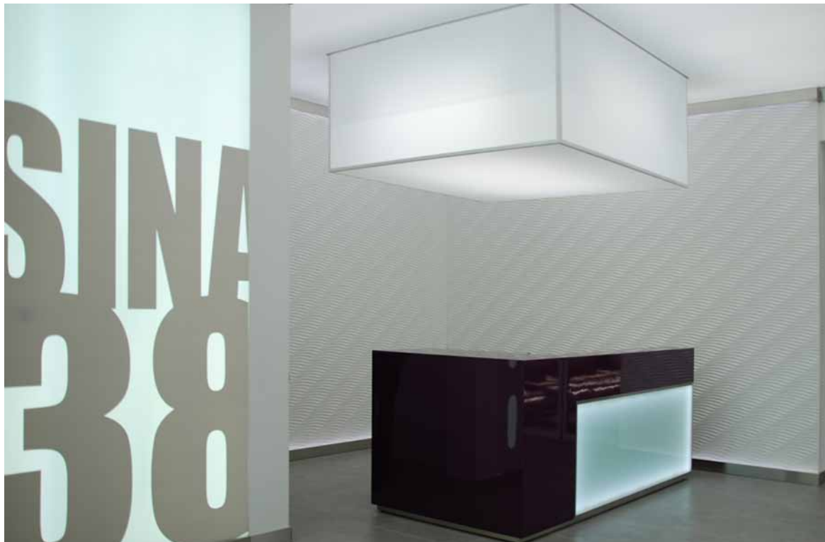
2009-2010 Milano - via Messina 38

Principali Committenti: Beni Stabili Property Service Spa; Progeni Spa; Investire immobiliare Spa; Fintecna Spa